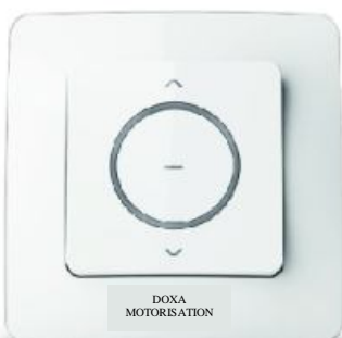
Télécommande 2 canaux